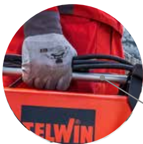
Asa de metal Pega em metal