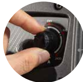
Regulación sencilla Regulação simples