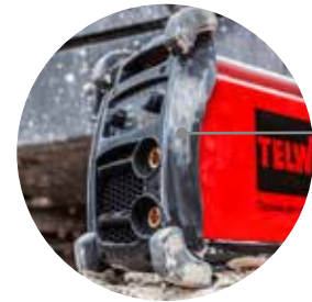
Anti-shock bumpers Paraurti antishock