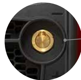
Ø 50 mm socket Presa Ø 50 mm